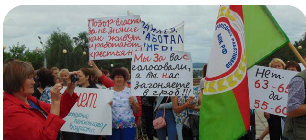
Митинг против повышения пенсионного возраста, 2018 г.

На предприятиях агропромышленного комплекса республики действуют инициативные и активные первичные профсоюзные организации, которые по праву занимают победные места в смотрах-конкурсах на лучшую ППО,