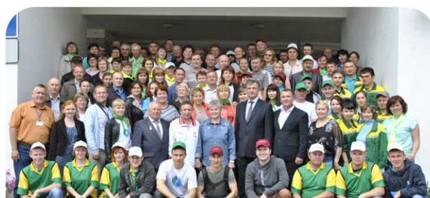
Слет профорганизаций предприятий АПК, 2019 г.