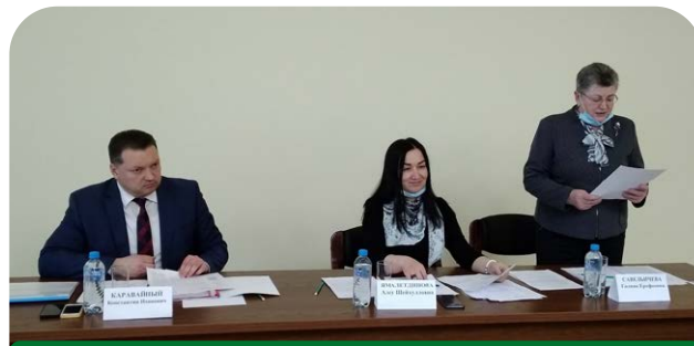
Заседание Общественного совета при Минсельхозе области

Уполномоченные лица по охране труда первичных профсоюзных организаций Бологовской, Кашинской, Торжокской районных организаций Профсоюза и других участву-