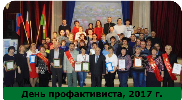
День профактивиста, 2017 г.

Пленум, секретариат и отделы обкома строили работу в соответствии с постановлениями партии, правительства, ВЦСПС, ЦК профсоюза. Обком профсоюза совместно с хозяйственными органами активно участвовал в разработке и реализации планов развития отраслей агропромышленного комплекса, способствовал устойчивости и дальнейшему росту производства, развитию движения рационализаторов и изобретате-